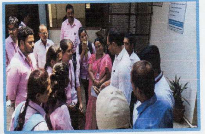
पाहुण्यांची विद्यार्थ्यांशी हितगूज